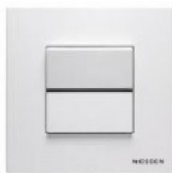
Ilustración Tipo *

Mecanismos empotrados para interruptores y tomas de corriente, Niessen modelo Zenit o similar.