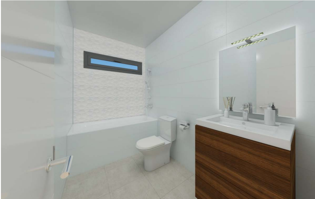
Ilustración con decoración Tipo *