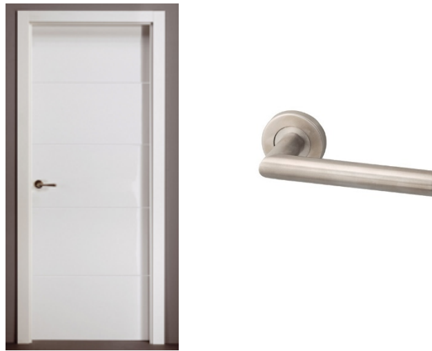
Ilustración Tipo *

Puertas interiores macizas lisas lacadas en color blanco o similar.